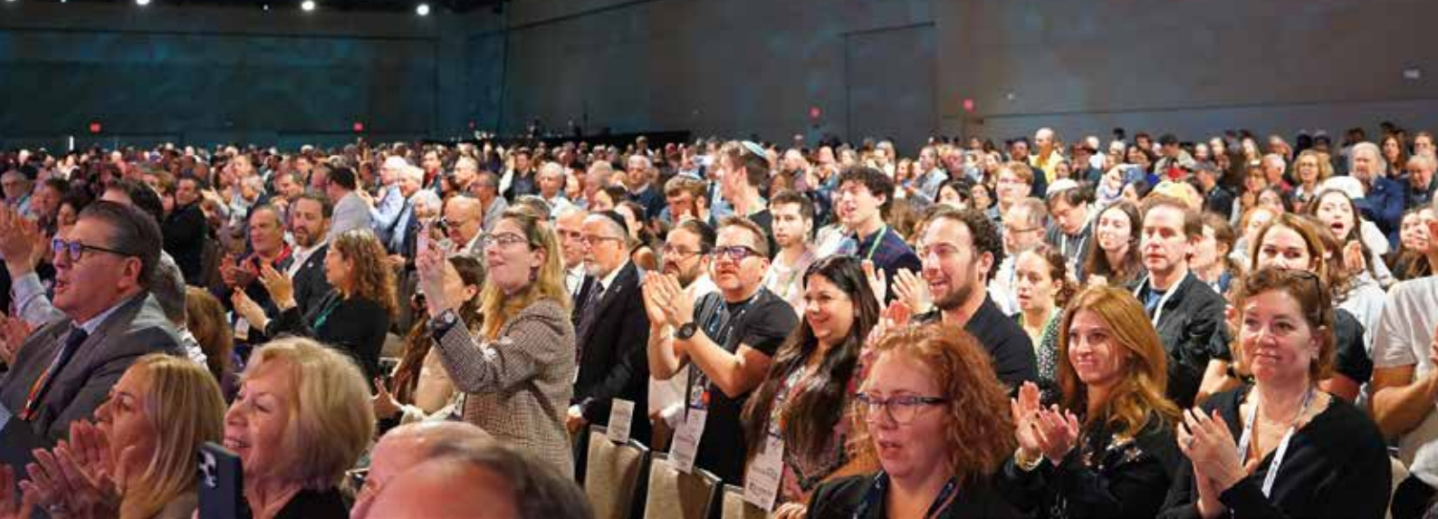
På konferensen i Dallas, Texas, samlades drygt 2 500 judar från fyra kontinenter.