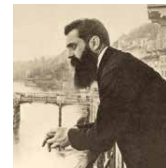
Den klassiska bilden på Theodor Herzl togs i Basel år 1901 när KKL bildades.

Den palestinska identiteten skapades den 2 juni 1964 då Palestinska befrielseorganisationen (PLO) bildades på Arabförbundets möte i Kairo när Gaza och Västbanken var arabiskt. Kairo-födde Arafat blev snart ledare för PLO, som uttryckligen ville utplåna Israel. □