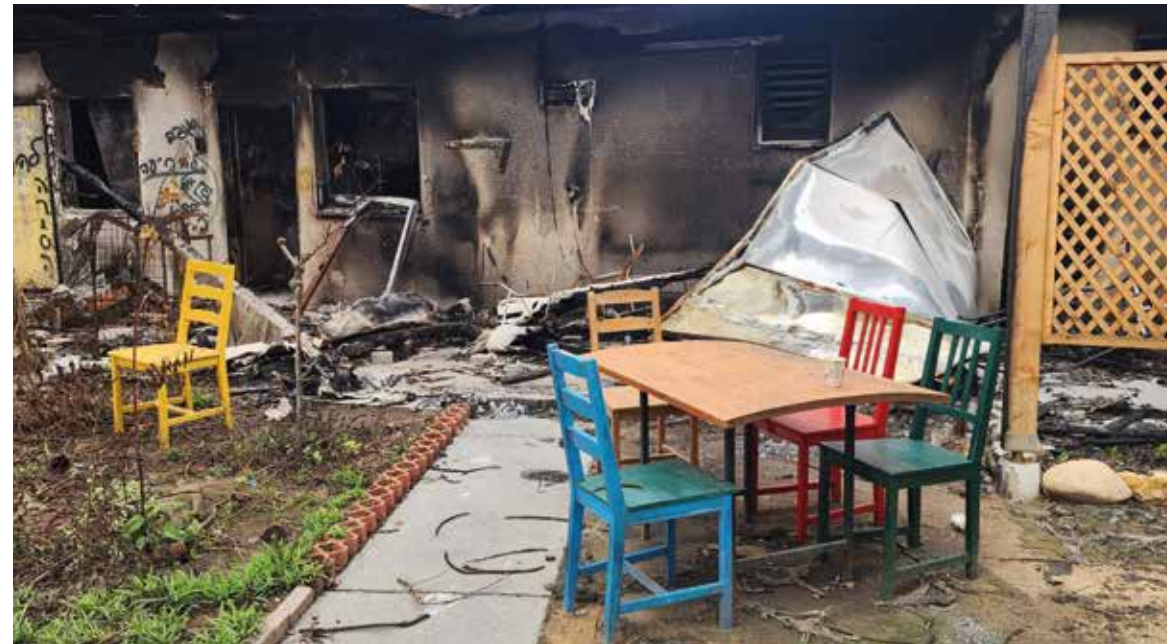
Invånare i södra Israel evakueras efter missilattacker från Gaza. Ett omfattande restaureringsarbete väntar nu i både norr och söder för att invånare ska kunna återvända.