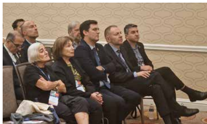
Ledningen för KKL-JNF i Jerusalem lyssnar på föredraget om parken och den digitala utställningen av Raoul Wallenberg.