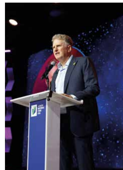
Skådespelaren Michael Rapaport talade på konferensen i Dallas.

– Efter att ha flyttat omkring lite så har det blivit nyttigt att få det här perspektivet att vi är beroende av varandra för att kunna etablera en säker judisk framtid. □