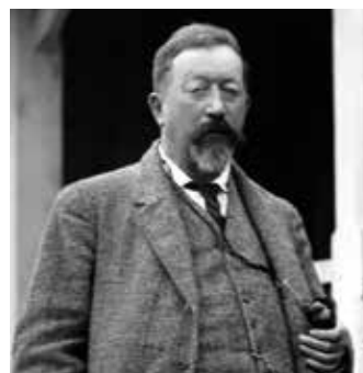
LKAB:s förste vd Hjalmar Lundbohm var en stor lobbyist för rasbiologi.

Nyligen utförde islamistiska miliser besläktade med Hamas ett folk mord i Syrien på folkgruppen Yazidier i ett inbördeskrig som tagit livet av en halv