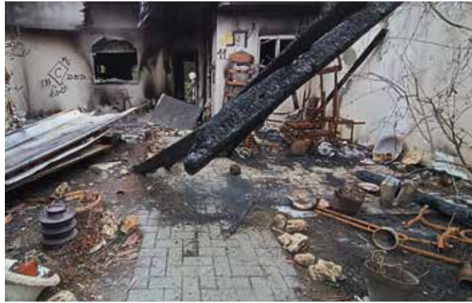
Förstörda hus i Nir Oz.

Förutom de mänskliga tragedier, på båda sidor, som