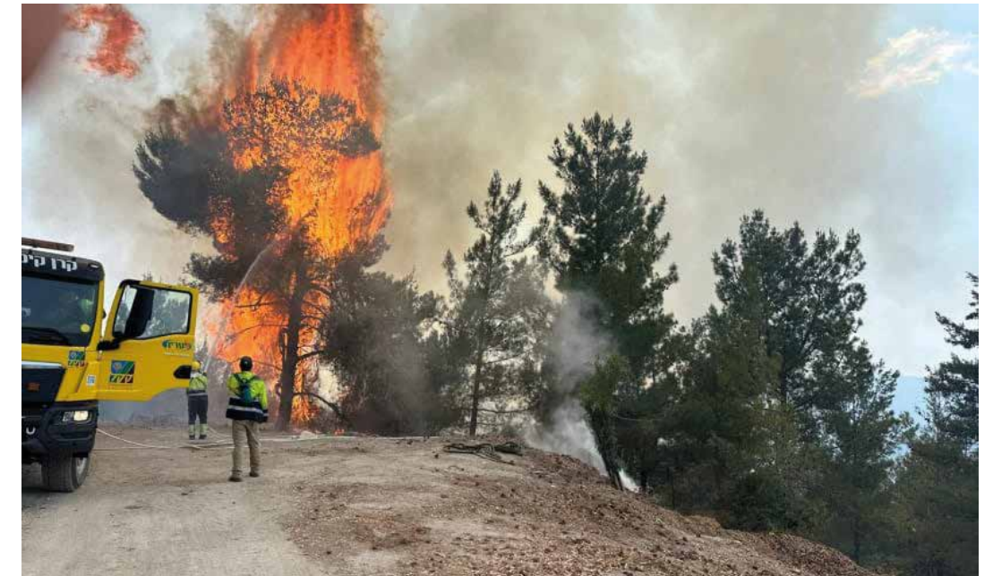
KKL:s brandbilar och personal bekämpar bränder i norra Israel som förorsakats av Hizbollahs missiler.

Istället har FN-styrkan Unifil tillåtit Hizbollah att bygga upp en omfattande militär närvaro i området, som i oktober förra året började användas för attacker mot Israel. Omkring 10000 missiler har sedan dess avfyrats av terrorgruppen.