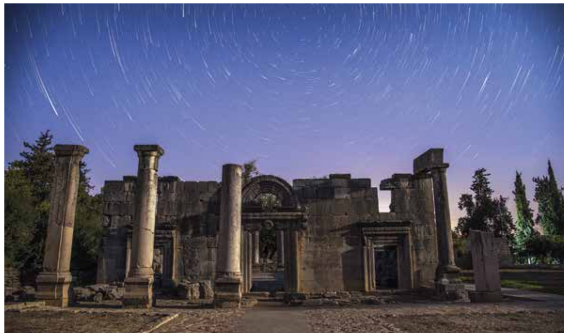
Baram synagoga i norra Galileen vittnar om en kontinuerlig judisk närvaro i Israel från forntiden till idag. Den är en av 24 synagogor i området som byggdes på 200- och 300-talen.

har lagt stora landområden i Mellanöstern, Nordafrika samt ända bort till Malaysia i bortre Asien under sig via krig och förtryck av områdets ursprungsbefolkningar. Även vissa delar av Europa drabbades av den muslimska invasionen under vissa epoker i historien.