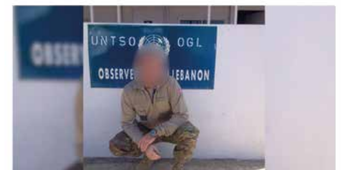
Dansk FN-soldat beskriver Hizbollahs hot.