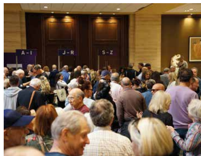
Delegater registrerar sig till JNF:s konferens.

– Det som var slående var alla mina kollegors rapporter om hur antisemitismen slagit rot och stigit till en alarmerande nivå i länder som USA,