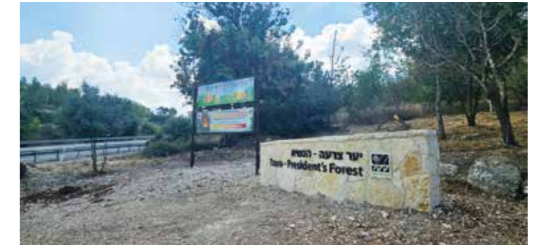
Raoul Wallenberg Park ligger i Tzora President Forest en dryg halvtimmes bilresa från Jerusalem. Parken är nu färdigställd men invigningen är framskjuten på grund av kriget.

Den digitala utställning om Raoul Wallenbergs insatser och det svenska byråkratiska motståndet mot Förintelsen i Budapest – liksom den svenske diplomatens tragiska försvinnan-