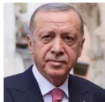
"Precis som vi gick in i Karabach, precis som vi gick in i Libyen, borde vi göra detsamma med Israel. Det finns inget som hindrar oss. Vi behöver bara vara starka...," sade president Erdogan den 31 juli i år.