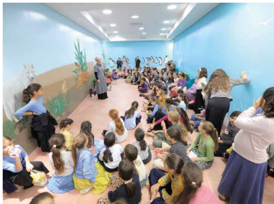
Shalva bedrev skolverksamhet på förmiddagarna för hundratals barn som evakuerats, i de lokaler som på eftermiddagarna används för den ordinarie verksamheten.

Under samma första vecka efter massakern ringde Jerusalems borgmästare till Shalva och berättade att det hade anlänt tusentals