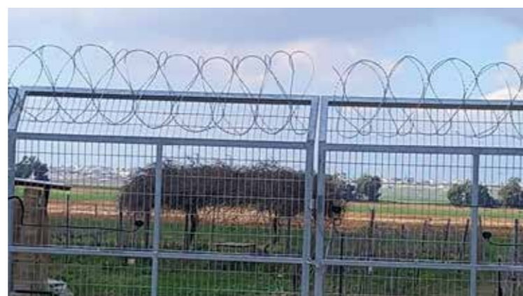
Denna port, i ett stängsel som har kritiserats hårt av omvärlden, infiltrerades av terrorister som attackerade Nir Oz den 7 oktober 2023.

säkerhetsmässig, militär och politisk katastrof för den arabiska och islamiska nationen. Vi skäms inte för att säga detta, sade han till den libanesiska TV-kanalen LBC. I skuggan av omvärldens nyhetsrapportering om kriget i Gaza planerar de som överlevde Hamas massaker att återvända till sina hem.