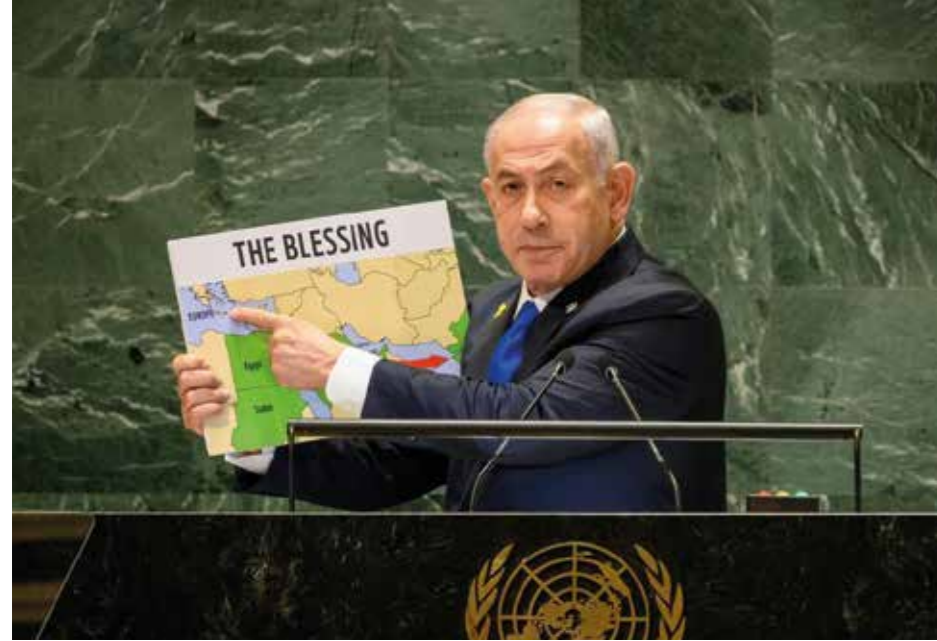
När Israel försvarar sig mot Iran i detta sjufrontskrig, kunde gränserna mellan välsignelsen och förbannelsen inte vara tydligare, sade Benjamin i sitt FN-tal.