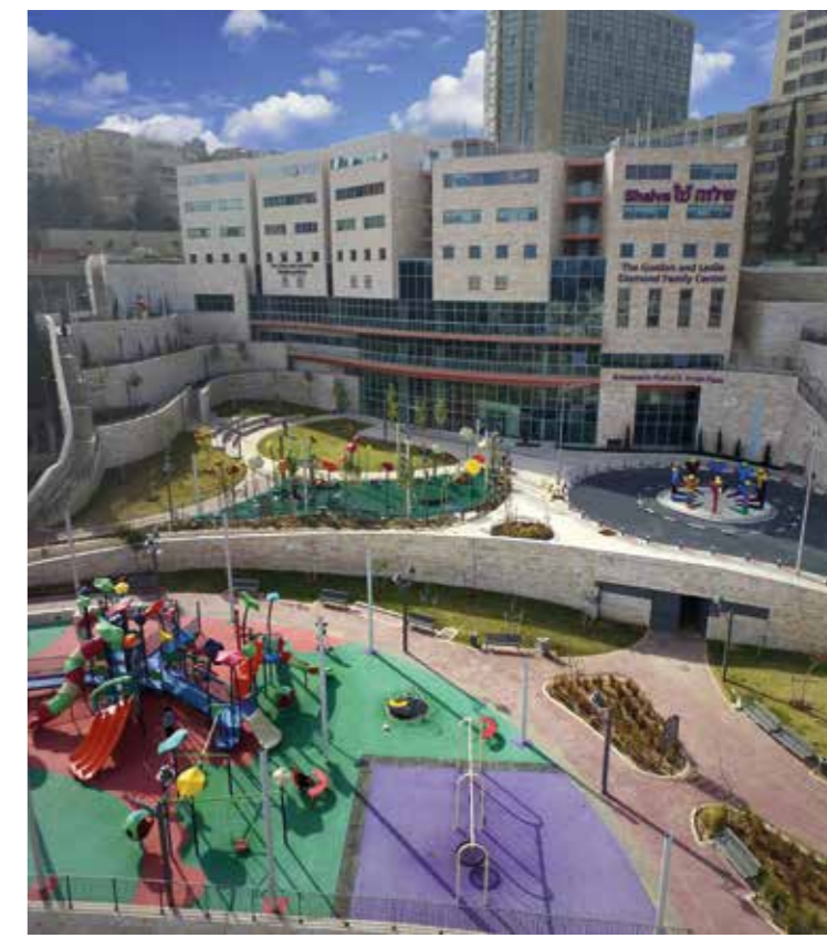
I juni meddelade regeringen att Shalva skulle få ett stort stycke mark som ligger precis bredvid det område där de har sina fastigheter i idag.

– Shalva är i framkant när det gäller barn med funktionshinder. Vi förändrar deras värld. Via undervisning, musikgrupper som Shalva band och en mängd andra aktiviteter spränger vi begränsningar.