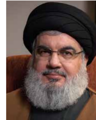
Israels försvarsmakt bekräftade att attacken var riktad mot Hizbollahs högkvarter, som låg under bostadshus i Beirut.

Hizbollah skapades 1982 och finansierades av Iran för att bekämpa den israeliska invasionen av Libanon samma år. Israels invasion skedde efter PLO:s mordförsök på Israels ambassadör