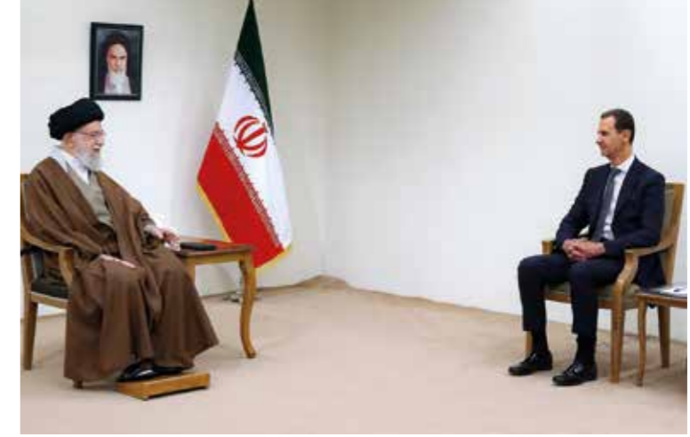
Syriens president Bashar al-Assad träffar Irans ledare Seyyed Ali Khamenei under sitt besök i Iran i maj 2022.

Nio anställda i FN:s flyktingorgan UNRWA fick nyligen sparken för inblandning i terrorattaken den 7 oktober. Israels utrikesdepartement menade att Hamas penetration av FN-organet är så djup att "det är omöjligt att säga var UNRWA slutar och Hamas börjar." Fler än 2 135 UNRWA-anställda är medlem-