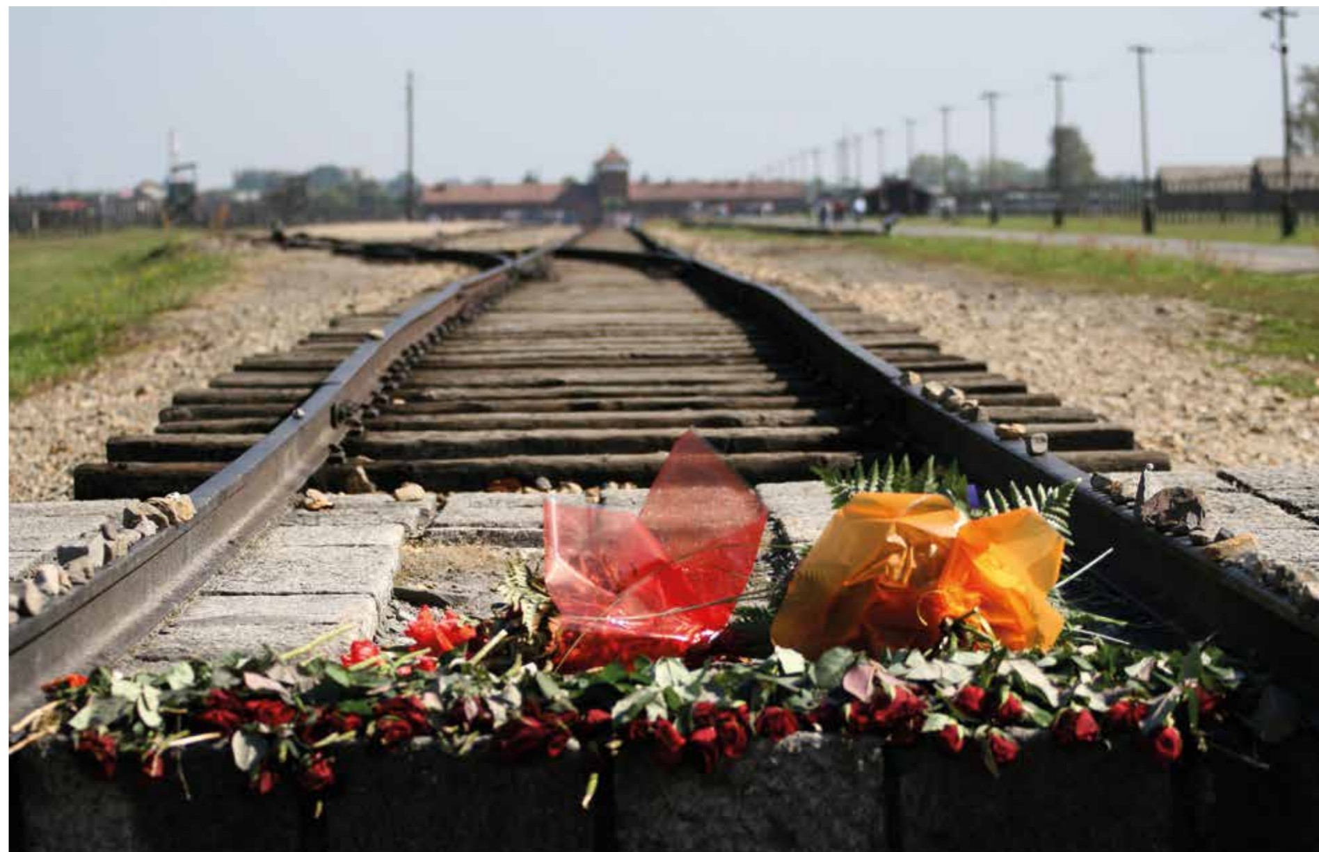
Våren 1944 transporterades 440 000 judar på Ungerns landsbygd till Auschwitz.

– Det är knappast en tillfällighet att Israel omnämns mer än 2300 gånger i Bibeln... □