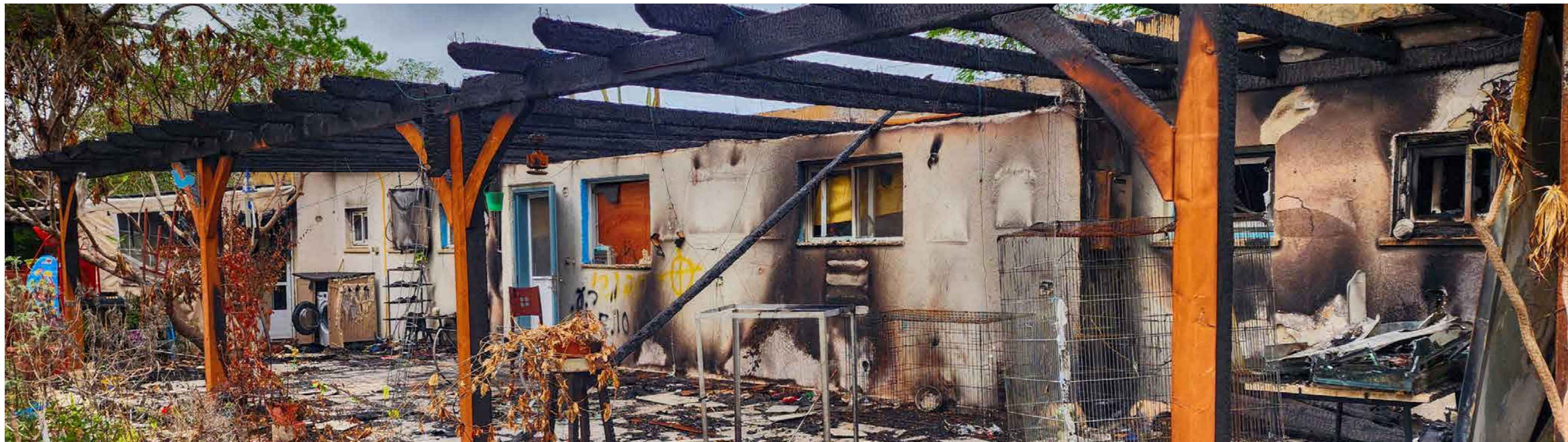
Över hundra terrorister från Hamas tillbringade flera timmar i kibbutz Nir Oz, dödade civila, våldtog kvinnor, förde bort gisslan och satte eld på hem inne i kibbutzen.