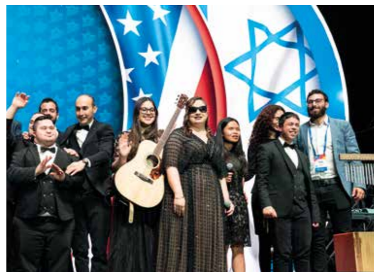
Shalva band uppträdde i den andra semifinalen av Eurovision Song Contest 2019 med en cover av "A Million Dreams".

– Varför reagerade inte världen när miljontals blev flyktingar och en halv miljon dödades i inbördeskriget i Syrien för tio år sedan?