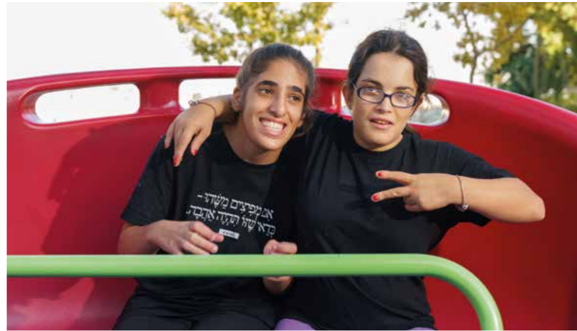
Shalva National Center är inte bara en byggnad eller en park - det är en vision om en värld där alla, oavsett förmåga, kan hitta sin plats och blomstra.