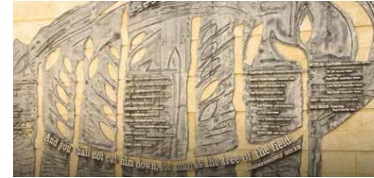
När israeliska diplomater går in genom entrén till UD i Jerusalem passerar de minnesväggen för diplomater som räknas som "Rättfärdiga bland folken". Sex av de 36 diplomaterna är svenskar.