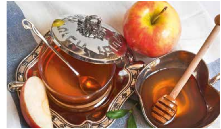
Vid Rosh Hashanah äter man ofta äppelbitar doppade i honung. En välsignelse för ett sött år uttalas innan måltiden.

Under Rosh Hashanah inleds kvällsmåltiden ofta med att äta