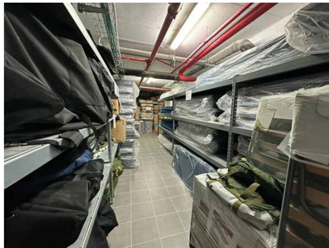
Shalva kan ta hand om 1 000 evakuerade väldigt snabbt. Även vid parkeringsplatserna under byggnaden kan sängplatser sättas in. Bilden är från Shalvas krislager.

Vad är din kommentar till omvärldens reaktion på Israels krig mot Hamas? När man läser tidningar i Sverige och i västvärlden får man nästan känslan av att varken gisslan, terrorgrupperna Hamas, Hizbollah och Islamiska Jihad, eller diktaturer som Iran, Ryssland, Kina och