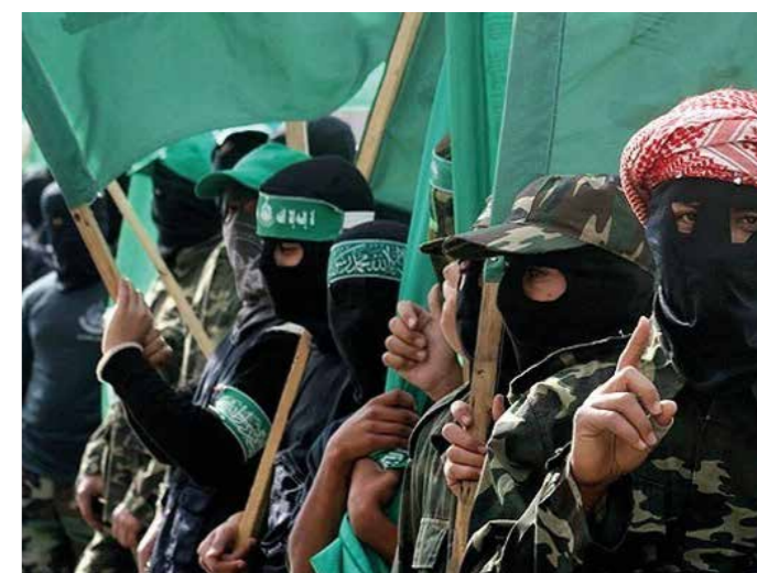
Hamas har sina rötter i det Muslimska brödraskapet som samarbetade med Hitler under andra världskriget.

Egypten var en av de främsta destinationerna för tyska nazisters flykt. Omkring 2