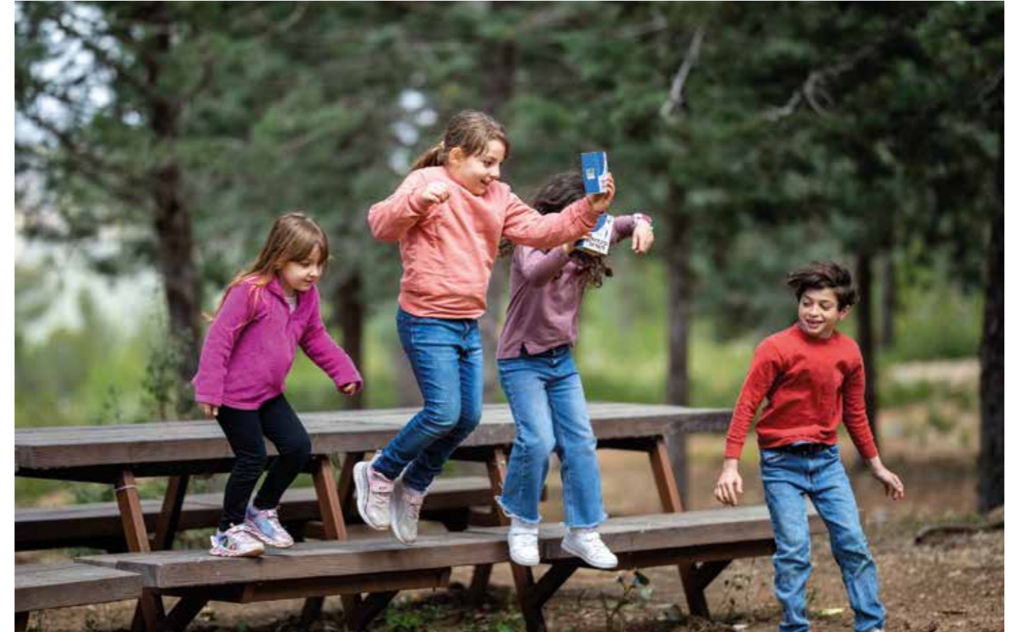
Be'eri-skogen fungerar som ett viktigt grönt bälte och är en fristad för rekreation och vandringar.

Löftet har brutits och Hizbollah har byggt upp ett stort raketlager och en gigantisk terroriststyrka, samt ett stort antal militära positioner ända fram till gränsen. FN-resolutionen lovade även att en förstärkt FN-styrka (upp till 15 000 personer) skulle hjälpa Libanon att hålla södra Libanon fritt från vapen och militärstyrkor som inte tillhörde den