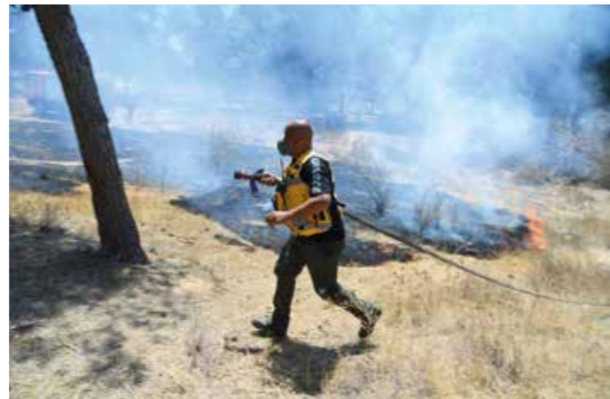
Brandskadorna är omfattande i södra Israel, på grund av brandbomber och missiler från Gaza.