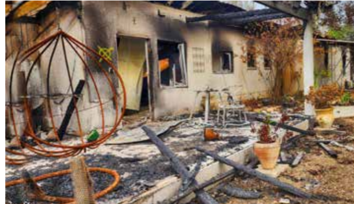
Förstört och utbränt bostadshus i Nir Oz.

Keren Kajemet har en rad projekt i de områden som utsattes för Hamas massaker den 7 oktober. Israel siktar på att nästan alla evakuerade från söder ska ha återvänt i