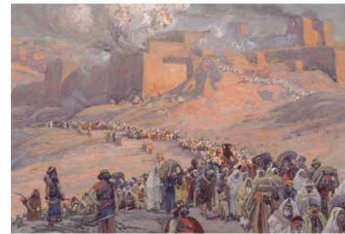
Judar har bott i Irak sedan den babyloniska fångenskapen för knappt 2 600 år sedan.

Några århundraden efter Haman skulle den grekiske kungen Antiochus VI Epifanes vanhelga templet och viga det åt den grekiske guden Zeus för att småa judarna och deras tro. Vid Jerusalems förstöring år 70 raserades templet igen, judarna fördrevs och kejsar Hadrianus reste ett